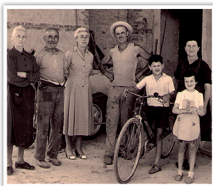
Famiglia Manzone 1956