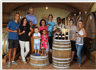
Famiglia Manzone 2016

Coltiviamo i vigneti secondo i principi di una viticoltura sana e sostenibile. L'erba, che cresce naturale nelle vigne, viene tagliata e lasciata a terra per formare humus. Tutti i vini non sono chiarificati, non sono filtrati e vengono aggiunte solo quantità minime di SO2.